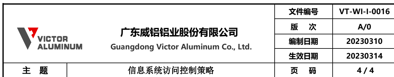
信息系统账号授权申请流程